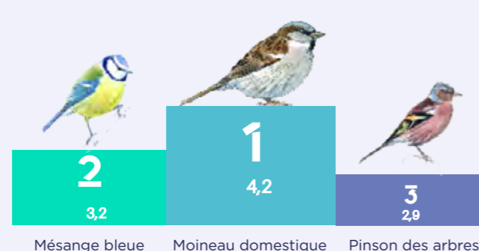
Espèces présentant la plus grande abondance moyenne par jardin en 2020